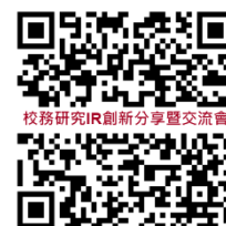
報名 QR code